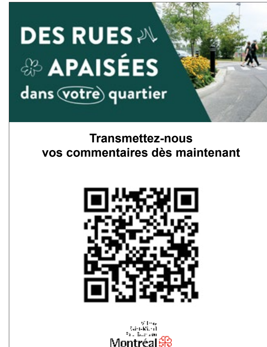
Panneau - Récolte des commentaires - Soirée de présentation