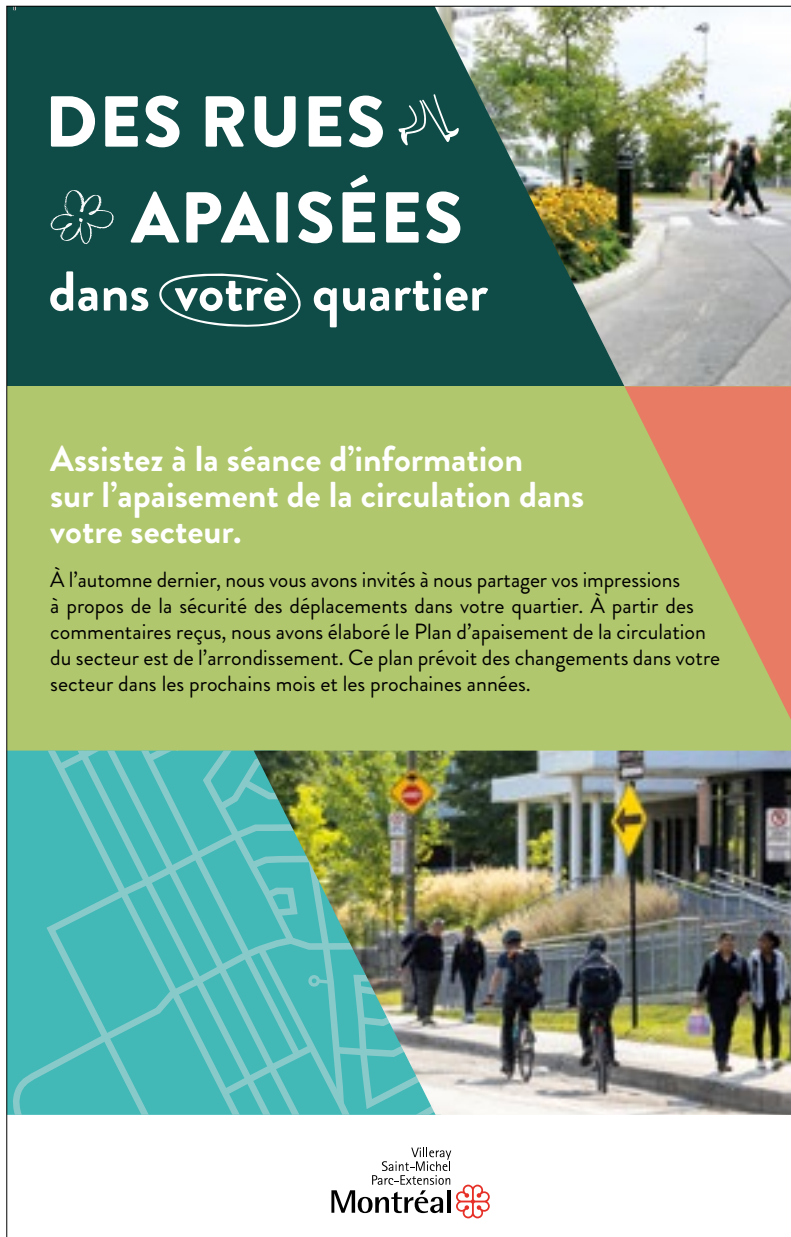
Carton postal - Soirée de présentation