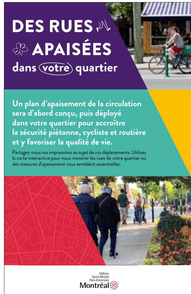
Carton postal - Démarche consultative