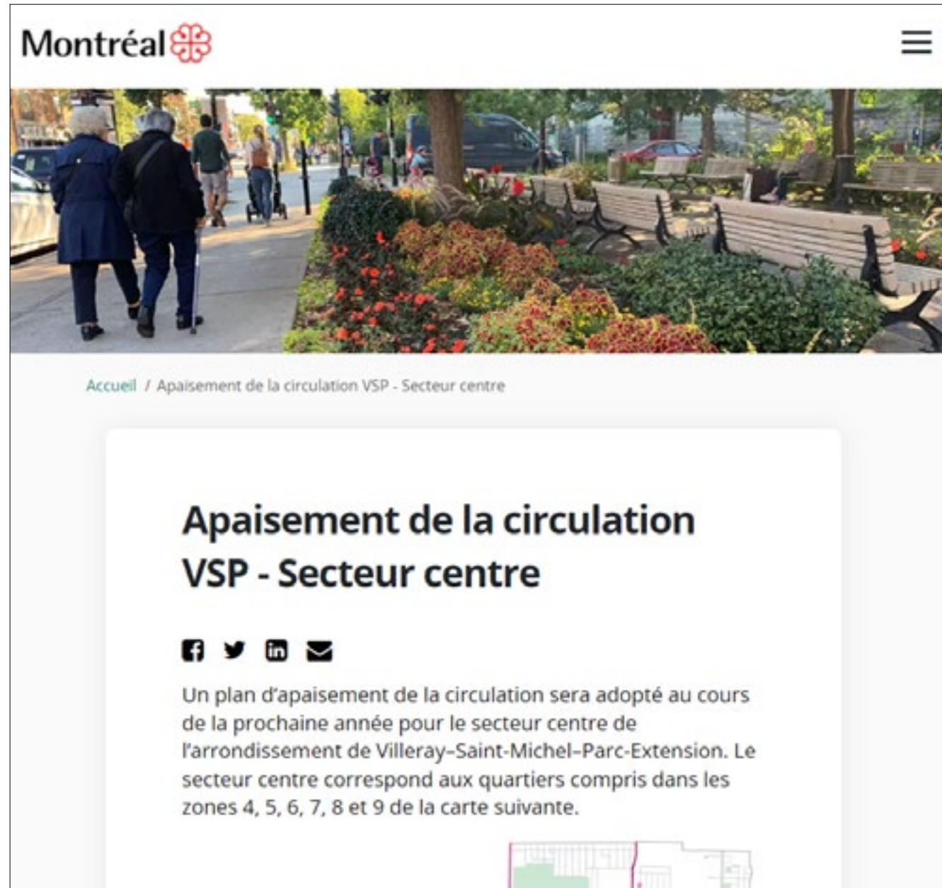
Page web Réalisons Montréal - https://www.realisonsmtl.ca/apaisement_centre_vsp