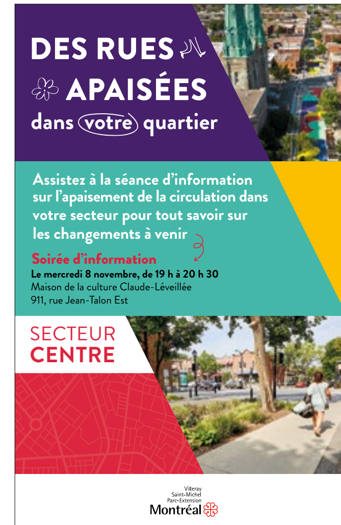
Carton postal - Soirée de présentation