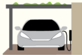
Abri d'auto permanent