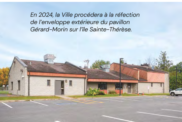
En 2024, la Ville procédera à la réfection de l'enveloppe extérieure du pavillon Gérard-Morin sur l'île Sainte-Thérèse.

Ils sont au cœur de nos vies. On les fréquente pour y apprendre à nager, pour y emprunter des livres, pour assister à un atelier culturel ou pour participer à la vie démocratique. Nos bâtiments municipaux sont précieux et ils ont besoin d'amour.