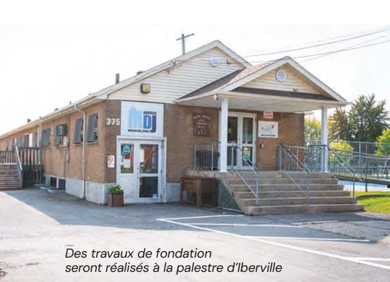
Des travaux de fondation seront réalisés à la palestre d'Iberville