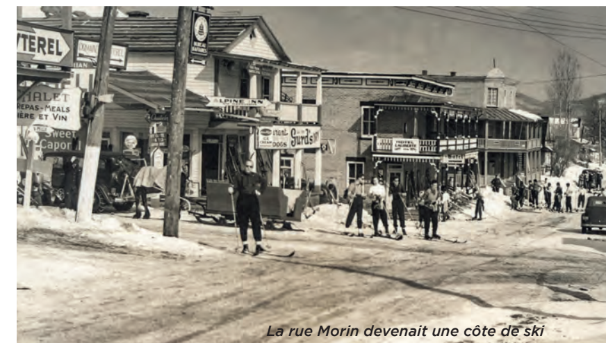
La rue Morin devenait une côte de ski

suscitent de nouveaux essors. Des commerces s'implantent graduellement aux abords routiers et le phénomène de la villégiature prend toujours plus d'ampleur. Depuis, même si la proportion de villégiateurs reste importante, cette clientèle a cédé le pas aux nombreux résidents qui sont venus s'installer en permanence sur notre territoire.