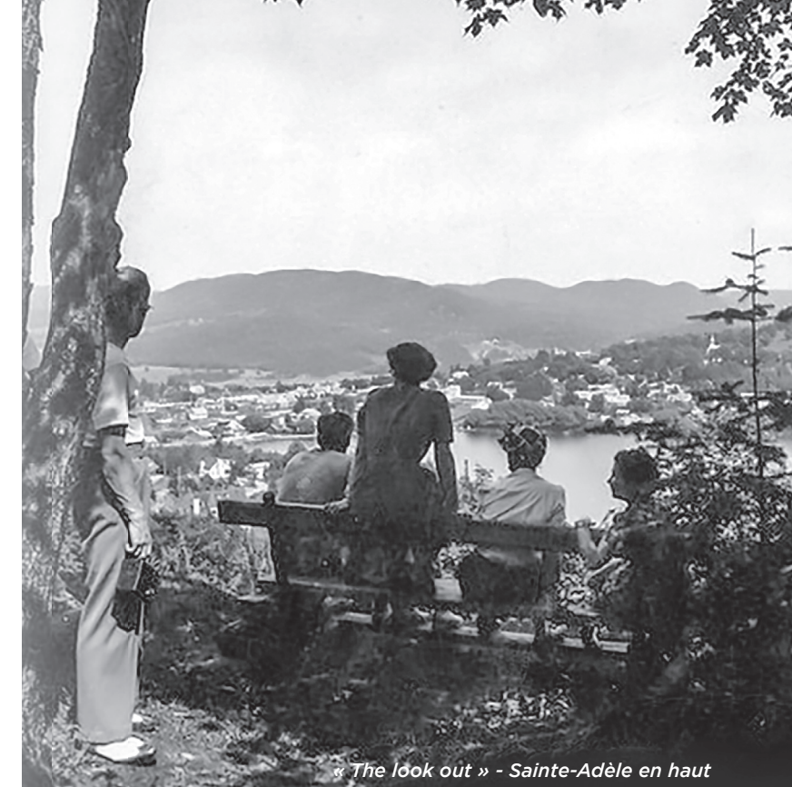
« The look out » - Sainte-Adèle en haut

Le parachèvement de la route 11 en 1945, et le prolongement de l'autoroute des Laurentides de Saint-Jérôme à Sainte-Agathe en 1964,