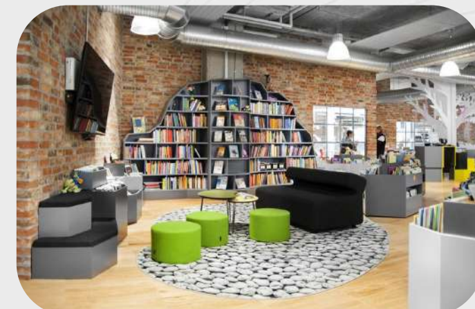
Bibliothèque de Herning, Danemark