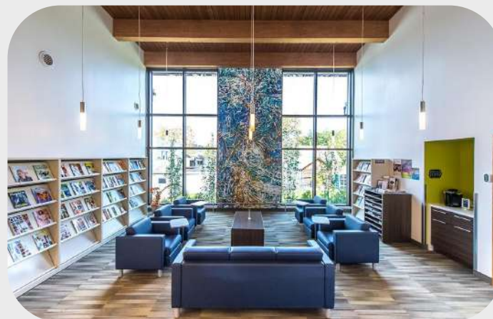
Bibliothèque de Saint-Hippolyte, Laurentides