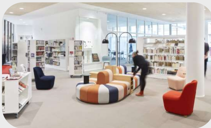
Médiathèque intercommunale du Pays sabolien, France