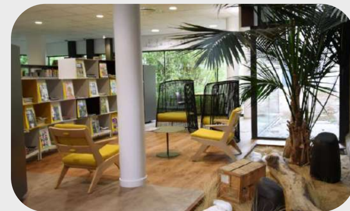
Médiathèque de Pornichet, France