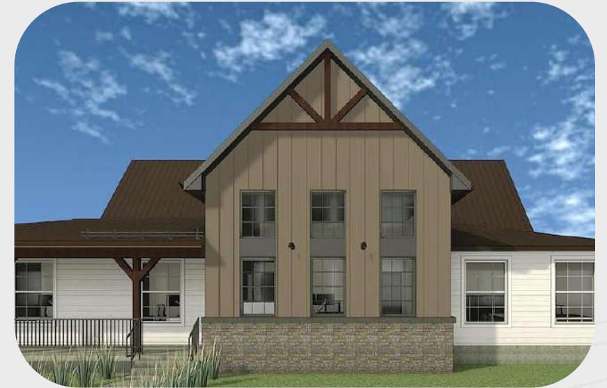
Nouveau bureau municipal, Canton de Bedford