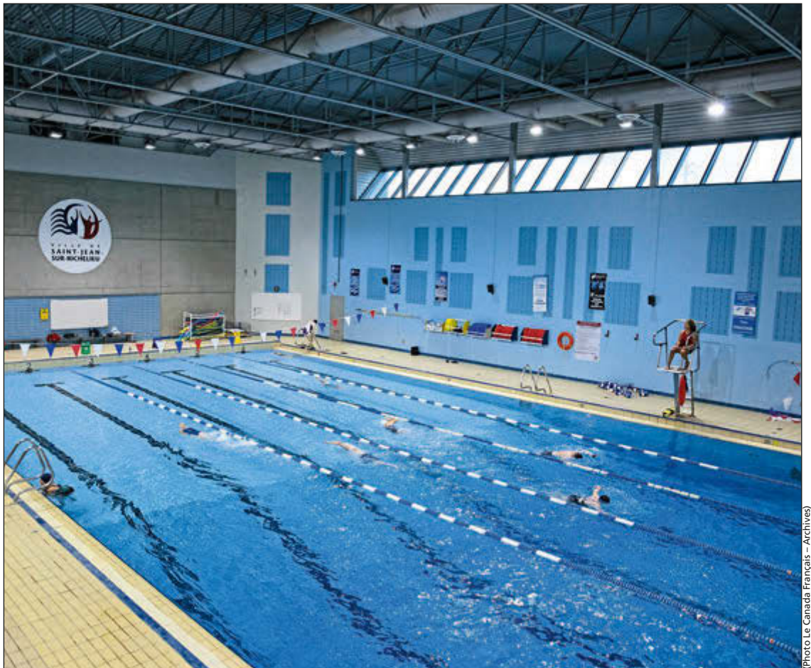
Les travaux de réfection du Complexe sportif Claude-Raymond nécessiteront la relocalisation des activités aquatiques pour les prochains mois.

Précisons que le Complexe sportif Claude-Raymond fait l'objet d'une première mise aux normes depuis sa construction en 1989, année où Saint-Jean-sur-Richelieu accueillait la 25 e Finale des Jeux du Québec.