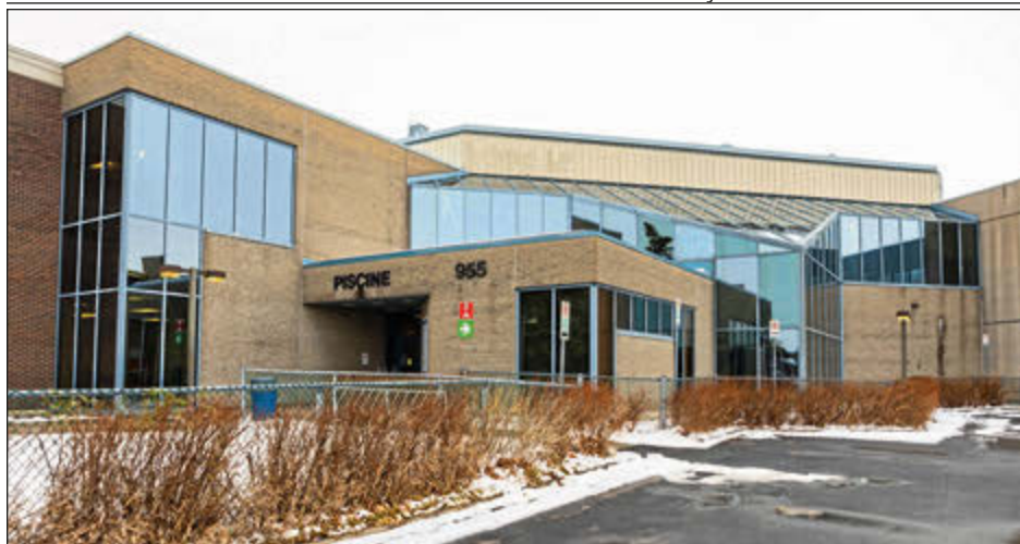
La piscine du Complexe sportif Claude-Raymond rouvrira dans la semaine du 15 avril.