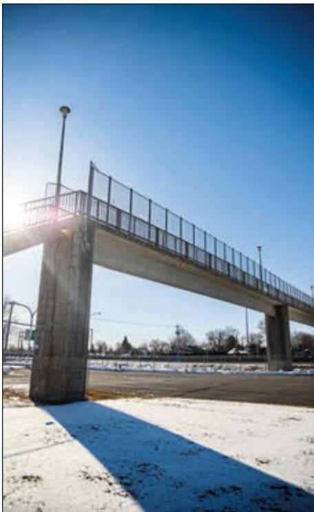
L'inspection de la passerelle Normandie est réalisée de manière préventive.

Rappelons qu'à la mi-février, la Ville de Saint-Jean-sur-Richelieu a bloqué le passage aux piétons sous les escaliers de la passerelle au moyen de barrières après avoir constaté la chute localisée de fragments de béton. La Ville indiquait alors que l'analyse préliminaire effectuée démontrait que la structure des escaliers n'était pas affaiblie et que leur stabilité n'était pas menacée.