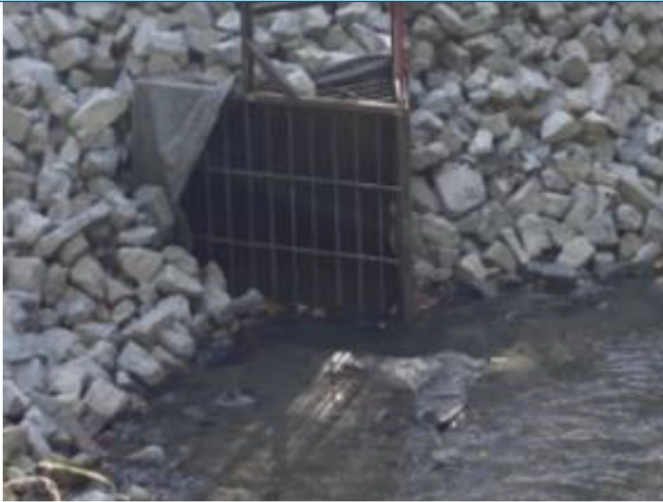
Bye bye castors!