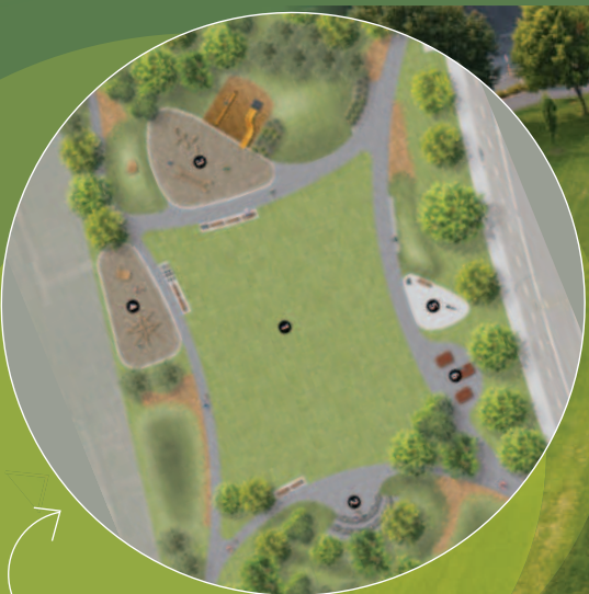
Le plan d'aménagement imaginé par la firme Stantec

JOIGNEZ-VOUS À LA FÊTE D'INAUGURATION : SAMEDI 28 SEPTEMBRE, DÈS 10 H