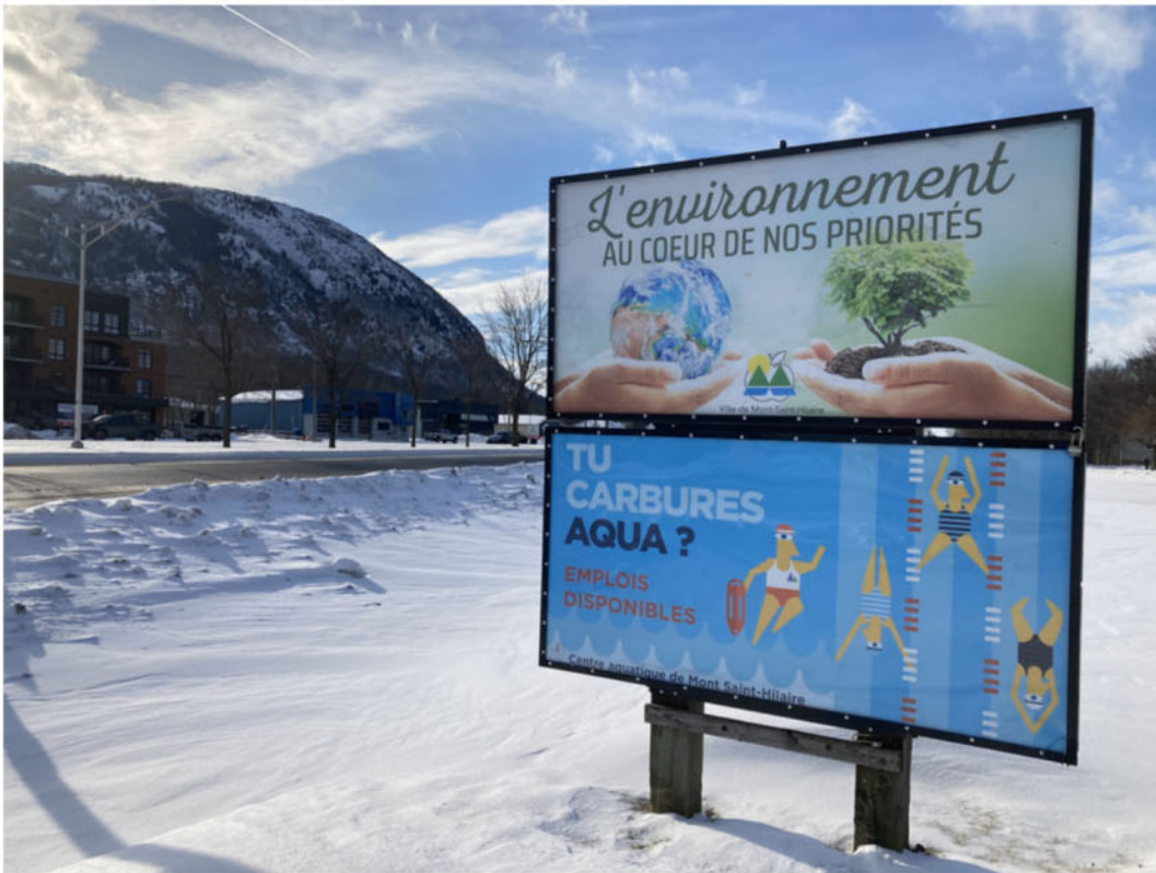
Panneaux d'entrées de ville