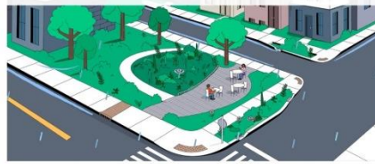
Extrait de la capsule "Comment ça marche un parc ou une place éponge?" | Animation : Productions Cina

Actualités Événements Contenu Collectif Top 100 Trouver un emploi →