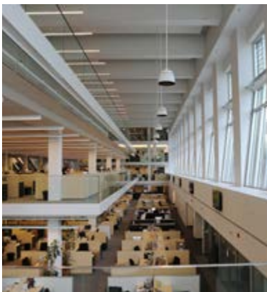
Bureau de La Presse +