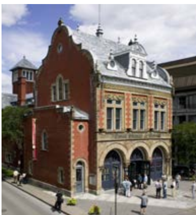
Centre d'histoire de Montréal